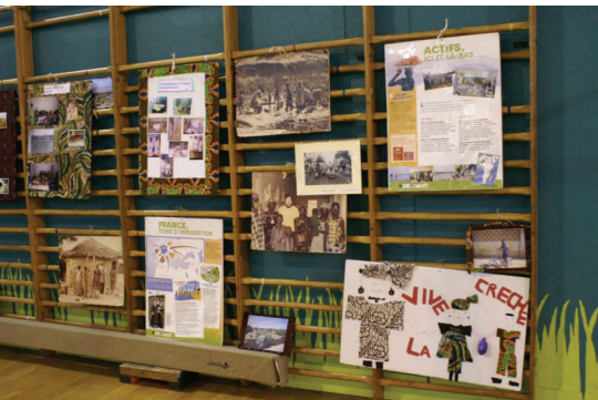
Exposition sur le « double-espace » en France