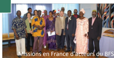
Missions en France d'acteurs du BFS

Les dix ans d'expérience du PAIDEL sont mis à profit pour accompagner les partenaires du programme dans la mise en place effective de dispositifs mutualisés fournissant des services adaptés aux besoins des collectivités territoriales et des acteurs locaux dans les domaines suivants : diagnostic de territoires, animation territoriale pluri-acteurs, planification concertée, mobilisation et diversification des ressources locales, co-opération territoriale.