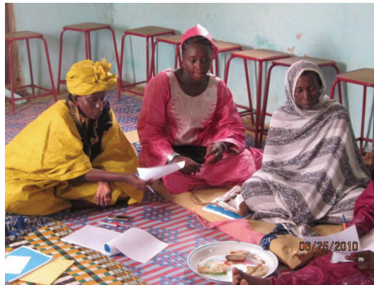
Des membres du cadre de concertation de la commune de Lexeiba (Mauritanie)