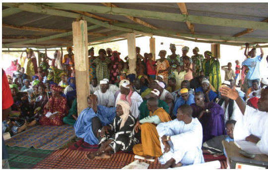
Des participants attentifs lors de l'élaboration d'un plan d'actions prioritaires (PAP)