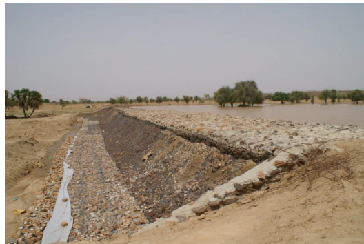
Barrage dans les environs de Bakel (Sénégal)

Fort de cette expérience, le PAIDEL est entré dans une seconde phase (2007-2009) visant à élargir le champ géographique de son intervention et à aborder des problématiques complémentaires : la co-opération territoriale, le co-développement et le développement économique .