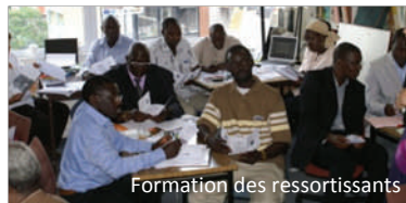
Formation des ressortissants

La co-opération décentralisée , par l'accompagnement des associations de ressortissants afin qu'ils jouent pleinement un rôle de « passerelle » entre leur collectivité territoriale en Europe et leur collectivité territoriale d'origine.