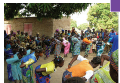
Les activités de concertation sont aussi l'occasion de fêtes populaires

Par ailleurs, cet axe transversal a pour objectif de contribuer au plaidoyer national autour des politiques à développer dans le cadre de ces thématiques. Le PAIDEL CT encourage les témoignages des partenaires et des acteurs régionaux par des rencontres , des voyages d'études , des émissions de radio (près d'une 30 aine pour l'ensemble de l'action), des reportages filmés , des sites-web , etc.