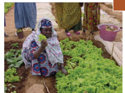
Le maraichage, une activité très appréciée des femmes de la sous-région

Par la construction d'infrastructures et la mise en place de services de base, les collectivités ont démontré leurs capacités à prendre des initiatives. Il est toutefois nécessaire d'aller plus loin : « à quoi nous sert ce dispensaire si nous n'avons pas d'argent pour payer les médicaments ? ». Pour y contribuer, la troisième phase du PAIDEL accompagne les collectivités et les acteurs locaux dans la conception de stratégies de développement économique . Les documents cadres qui en découleront, au niveau des territoires ou des filières porteuses, feront ressortir les besoins techniques et financiers des porteurs de projets économiques . Ces entrepreneurs se verront alors proposer des solutions adaptées mises en place par les partenaires du programme .