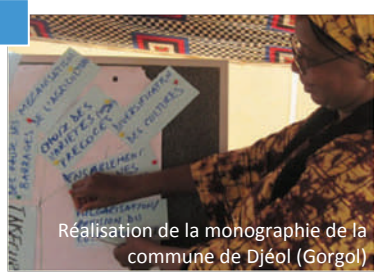
Réalisation de la monographie de la commune de Djéol (Gorgol)