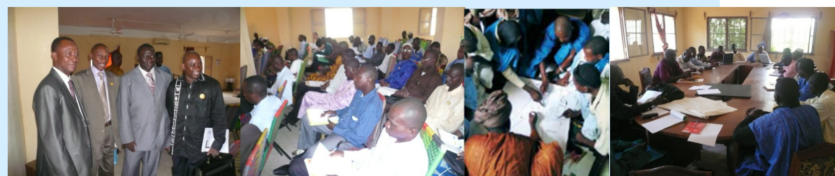
DIRECTEUR DNCT, PRÉSIDENT ARK, TECHNICIEN DNCT, PRÉSIDENT CONSEIL DE CERCLE DE KAYES